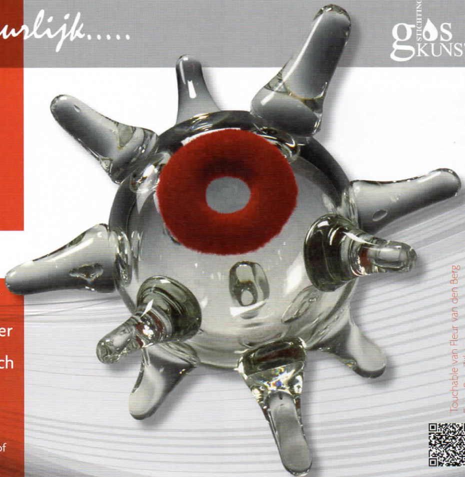
Touchable van Fleur van den Berg