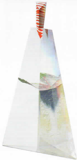
Yan Zoritchak (1944), 'Fleur Céleste', 1989, hoogte 55 cm.

Kijkdagen: 4-5-6 september Veilingdagen: 7-8 september