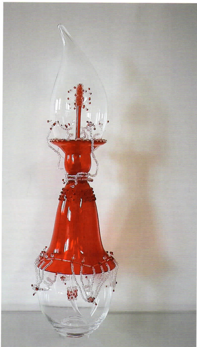
Janine Schimkat, Flame , 2018; gevonden glasobjecten, zilverdraad, glaskralen; h. 50 x 18 x 18 cm